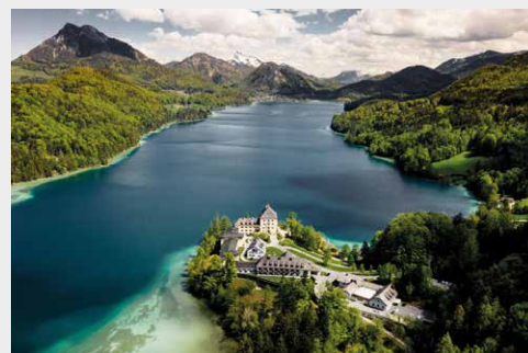
Rosewood Schloss Fuschl www.schlossfuschlsalzburg.com