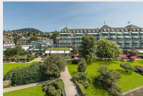
Brenner's Park Baden-Baden www.brenners.com