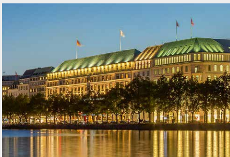
Hotel Vier Jahreszeiten Hamburg www.fairmont-hvj.de