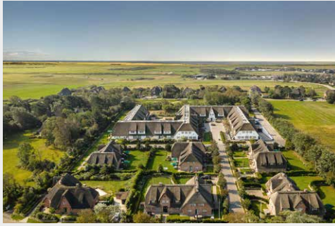
Hotel Severin's Resort & Spa www.severins-sylt.de