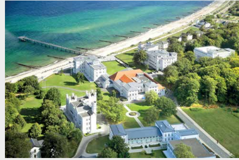
Grand Hotel Heiligendamm www.grandhotel-heiligendamm.de