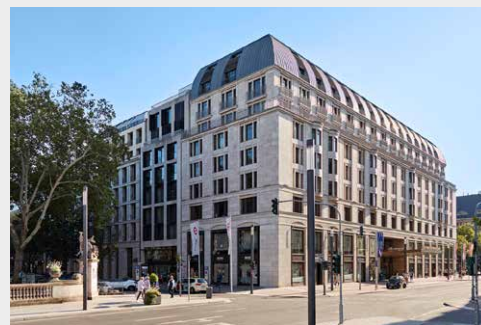
Breidenbacher Hof Düsseldorf www.breidenbacherhof.com