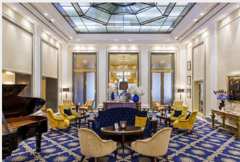
Excelsior Hotel Ernst Köln www.excelsior-hotel-emst.de