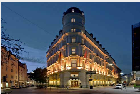
Mandarin Oriental Munich www.mandarinoriental.com